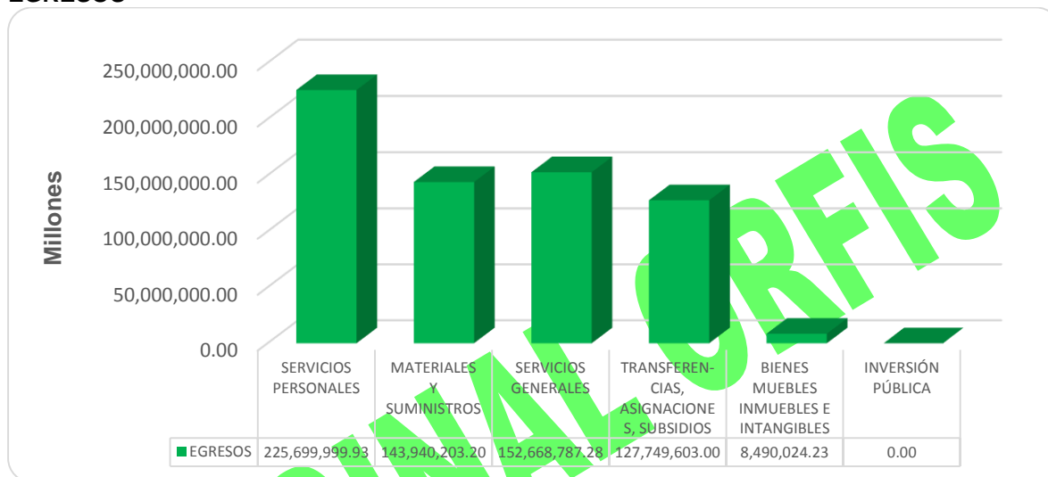
GRÁFICA 2 EGRESOS